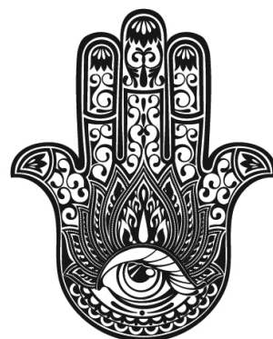
Пример амулета, который якобы защищает от дурного глаза